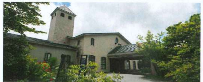
ホテル・エントランス