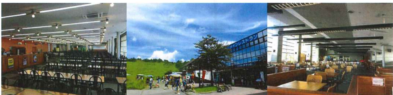
【スカイプラザ・レストラン（車山展望リフト側：お食事会場）】