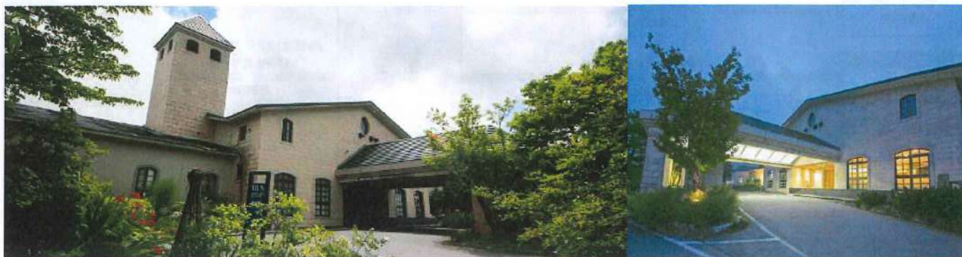
【ホテル・エントランス】