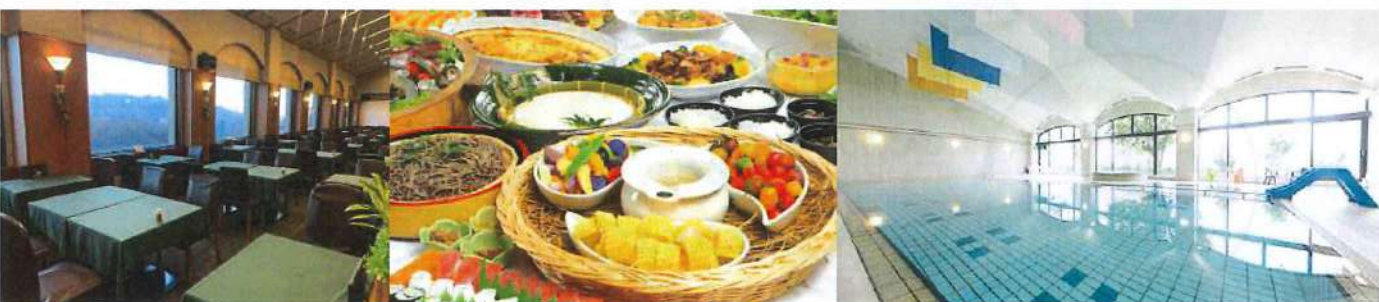
【レストラン・お料理イメージ・プール】